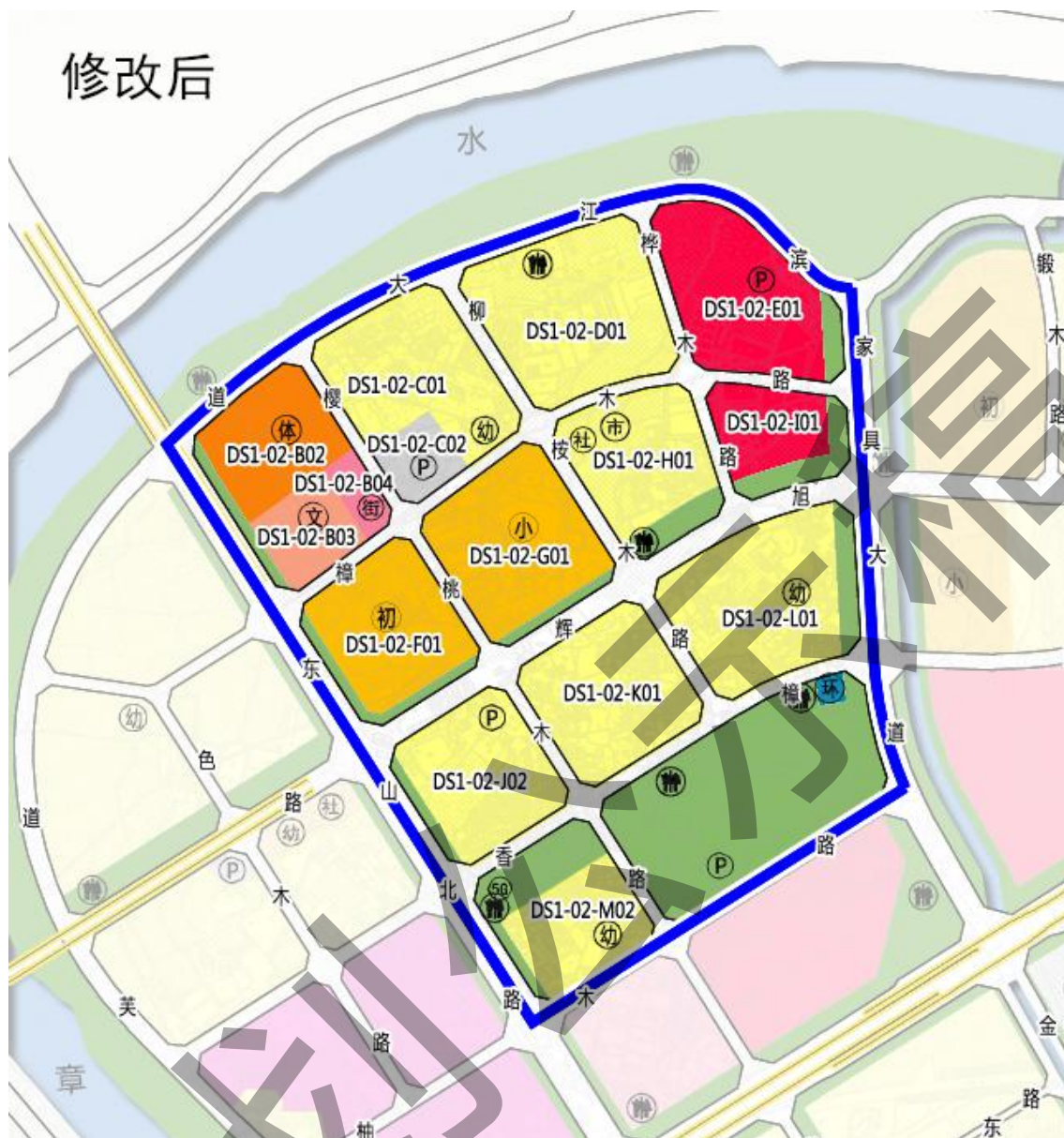
图 1-1: 鲁班广场周边地块修改前后规划用地情况对比图